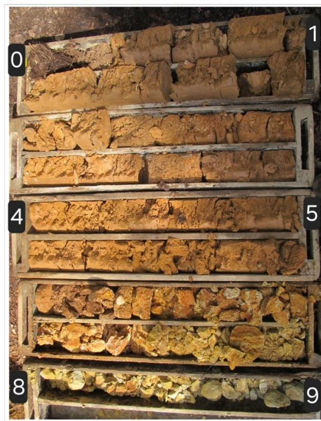
Jádrový vrt JV1, 0 - 9 m

Při odstávce dodávky elektrické energie nebo odstávce dodávky vody z obce Velichovky bude možné z vodojemu zásobovat nejen obec Hřibojedy, Malé Hřibojedy a Hvězdu, ale také obce Litíč a Libotov.